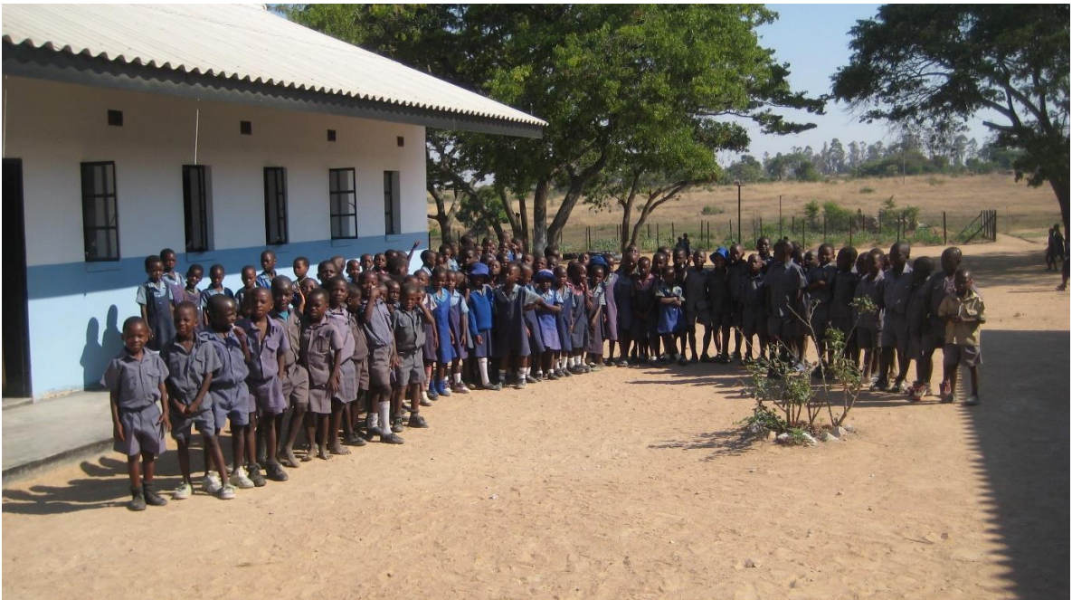
Leerlingen grade 1.

Verder zijn er plannen om een dependance te openen op een afstand van 7 kilometer van de Durlstone School. De Durlstone School wordt op verzoek van het comité de moederschool. Wij houden u op de hoogte van deze ontwikkelingen.